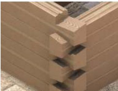
Naro e ciany wie cowej na zamek w jaskółczy ogon z ostatkami.