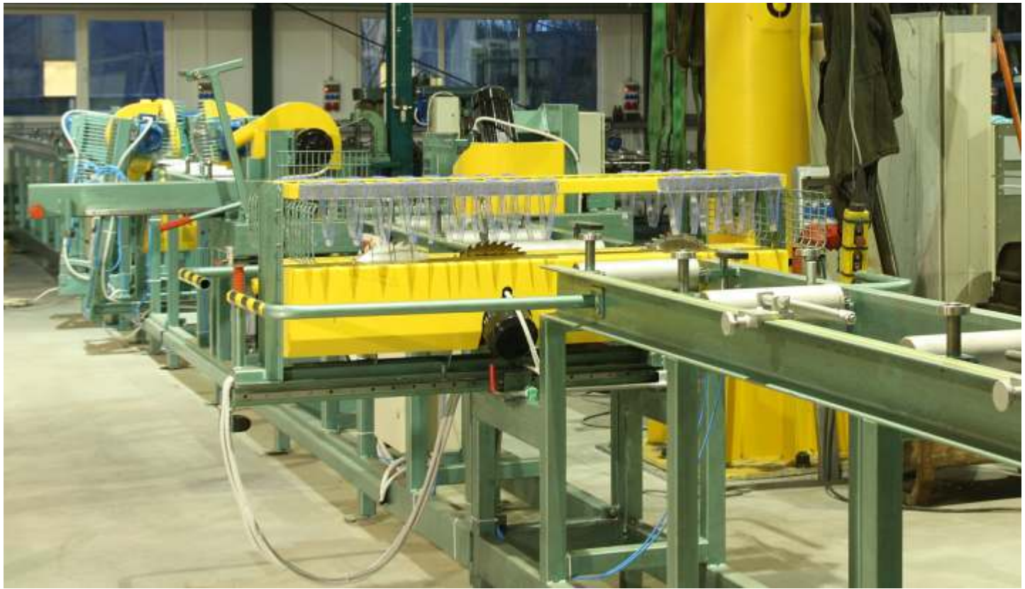
Linia do zacięcia w głowach „Jaskółczy ogon”.

Linia przeznaczona jest do wykonywania zacięcia w jaskółczy ogon. Wszystkie zacięcia wykonywane są piłami tarczowymi dzięki czemu uzyskujemy bardzo wysoką jakość i dokładność zadania. Linia stanowi niezbędny wyposażenie przy seryjnej produkcji domów z bali.