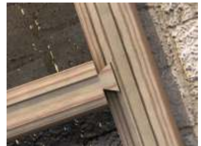
Pół czenie ciany zewn trznej ze ciany wewn trzn na półzamek teowy w jaskółczy ogon.