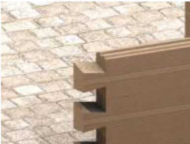
Zaci cie bala w jaskółczy ogon bez ostatków.