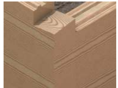
Naro e ciany wie cowej na zamek w jaskółczy ogon bez ostatków.