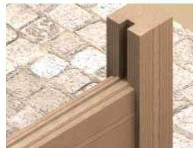
Pół czenie sumikowo-ł tkowe chroni ce drzwi i okna przed osiadaniem budynku.