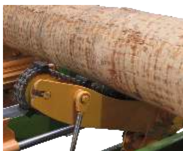
Obracak ła cuchowy