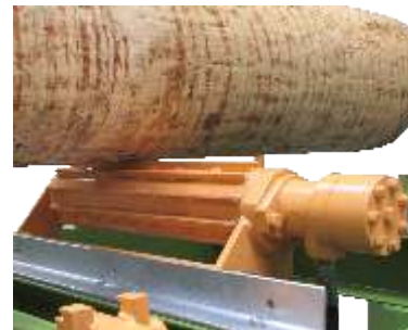
Rolka poziomowania z nap dem