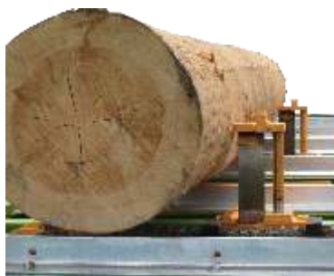
Kleszczenie - ruchome zabieraki