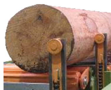
Zsynchronizowane kłonicie z kontrol wysoko ci