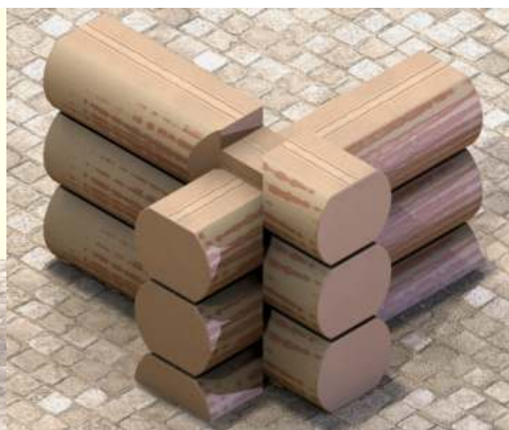
Narozienie ciany wewnętrznej z zacięciem w głównym skosie z resztkami.

Domy z bali w technologii okorowanych ze cianami poziomymi podstaw.