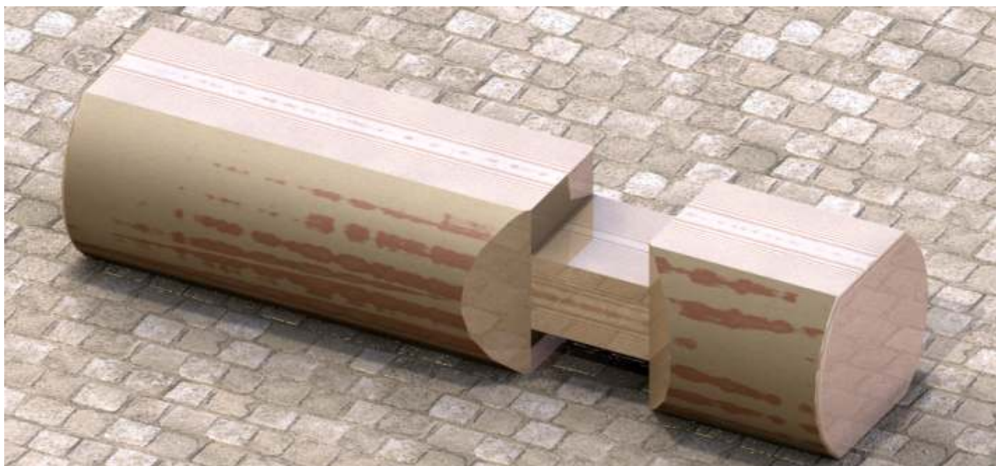
Bal okorowany dwustronnie ciany - przykład zacięcia do połowy ciany wewnętrznej i wewnętrznej.