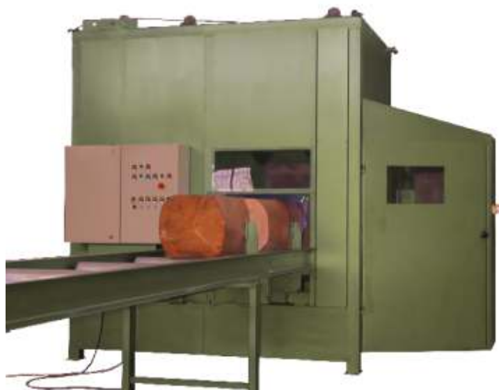
Obrabiarka do skrajnych zaciągów w głowach OZDW-600.