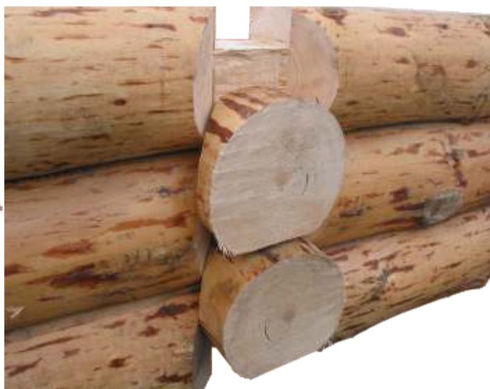
Widok półcienia ciany wewnętrznej bez osadków.

Obrabiarka przeznaczona jest do wykonania zaciągów w głowach skrajnych na okrągłych i podstawach płaskich takich jak i balach prostokątnych. Zaciąg taki charakteryzuje się dużą szczelnością i precyzyjnym ustaleniem półcienia. Obrabarka wycina wybrania za pomocą pił. Dzięki czemu nie jest wymagane duże zapotrzebowanie mocy w przeciwieństwie do frezowania. Średni czas wykonania zaciągu to 3 minuty.